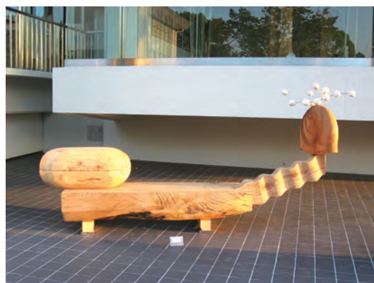
2011年 Dギャラリー前 「対峙する思弁」 340×75×150cm 楠