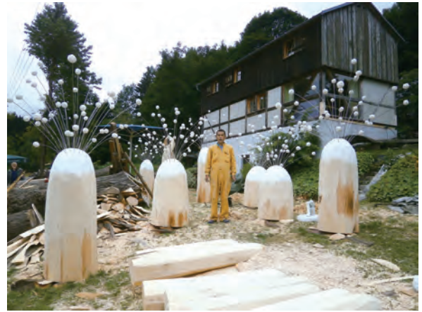
全体のバランスと空間を確認