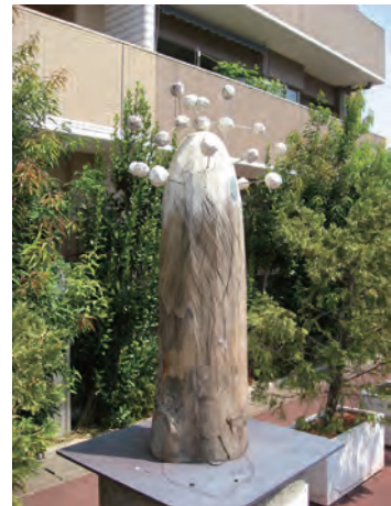
小牧駅前2012 「樹華」 60×60×210cm 楠、ステンレス棒