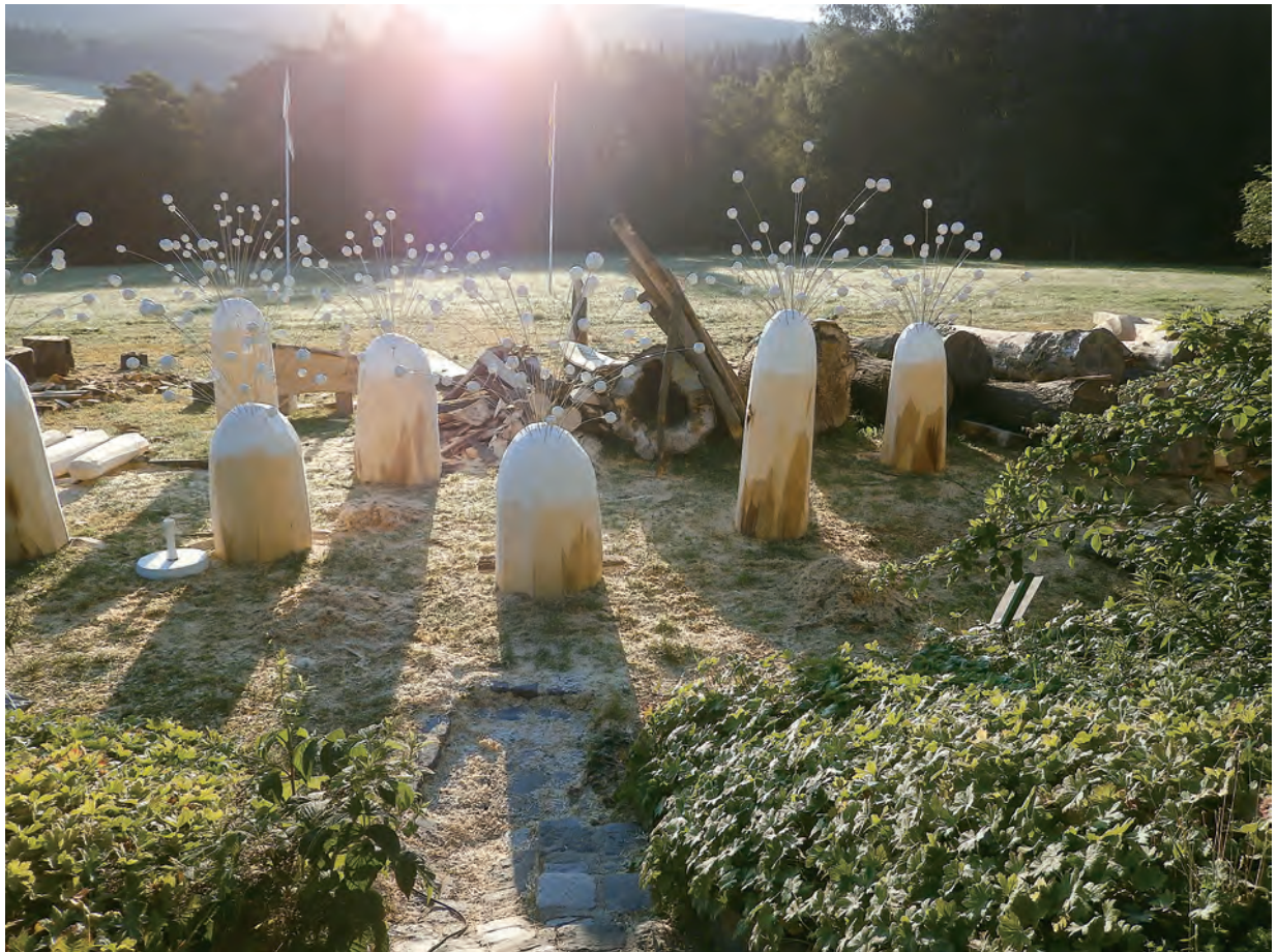
朝日に映える仮設置の作品