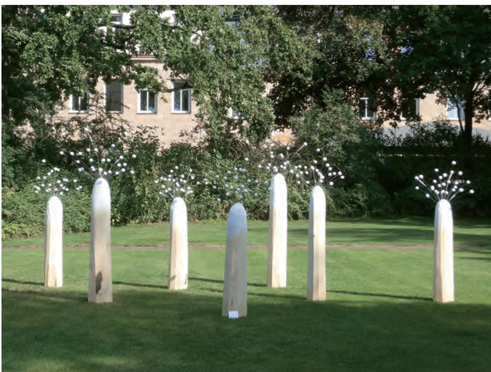
2015年8月6日 フェルト市内 「平和の祭典」展として復活教会屋外庭園に展示した「7つの風に吹かれて」 800×600×240cm ブナ、楠、ステンレス棒