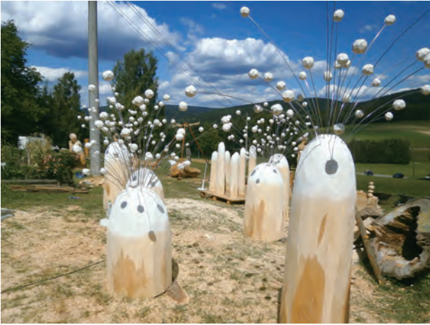
ザクセン州フォグランド マルクノイキルヘンの制作会場