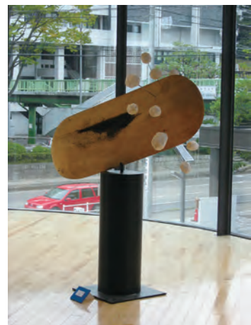
小牧市新庁舎2011 「プロメテウスの巽」 129×55×200cm タモ、楠、ステンレス棒