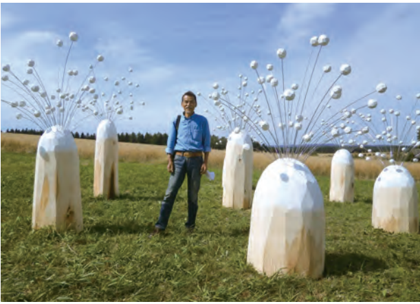
野外展示会場にて