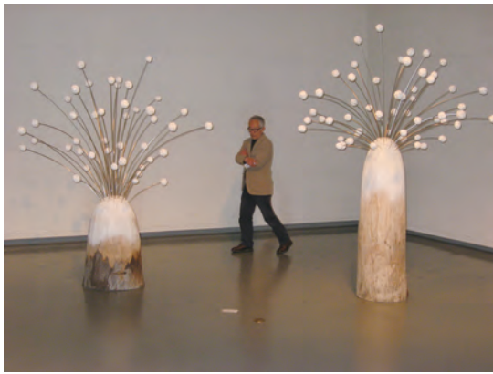
中部行動展2014 「風に…」 300×170×240cm 楠、ステンレス棒