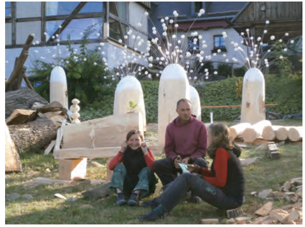
私の作品の前で談笑するドイツの参加者達