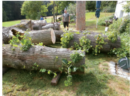
制作素材のリンデン(菩提樹)