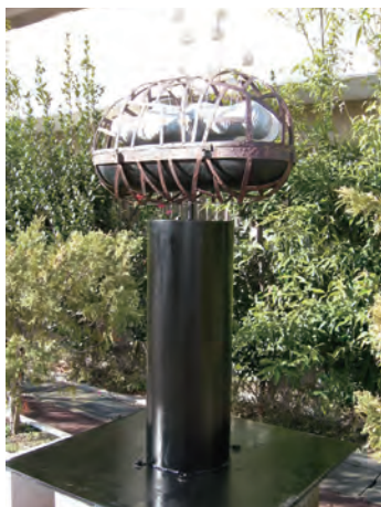
小牧駅前2015 「ノンドラの華」 70×45×175cm 鉄、楠、ステンレス棒