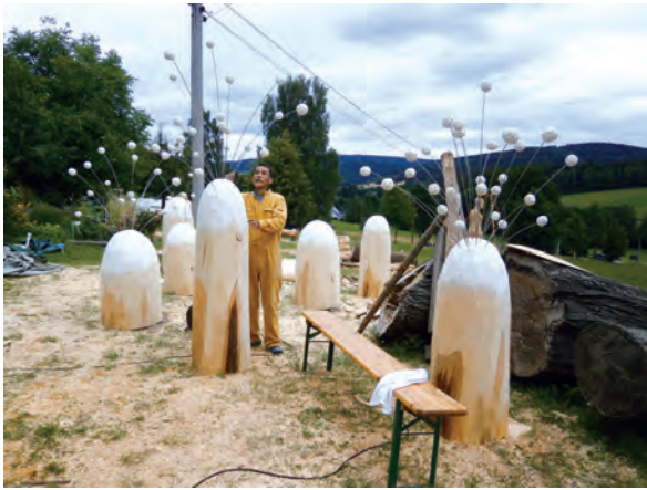
部品の取り付け作業