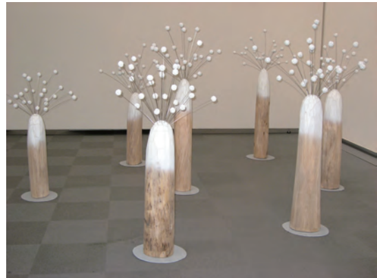
中部行動展2015 「風に吹かれて」 700×700×210cm 楠、ステンレス棒