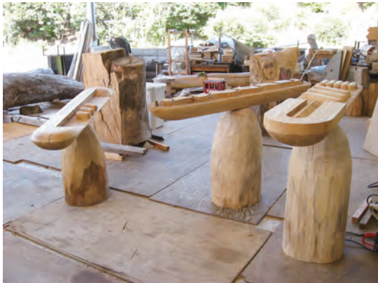
行動展2012 「プロメテウスの舟」 400×350×150cm 楠