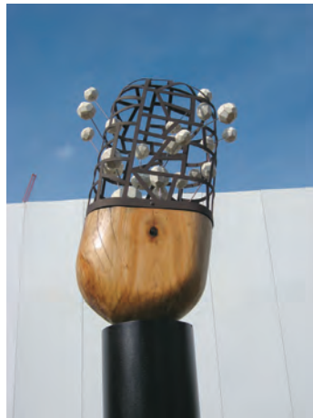
小牧駅前2014年 「ノンドラ」 70×40×220cm 鉄、楠、ステンレス棒