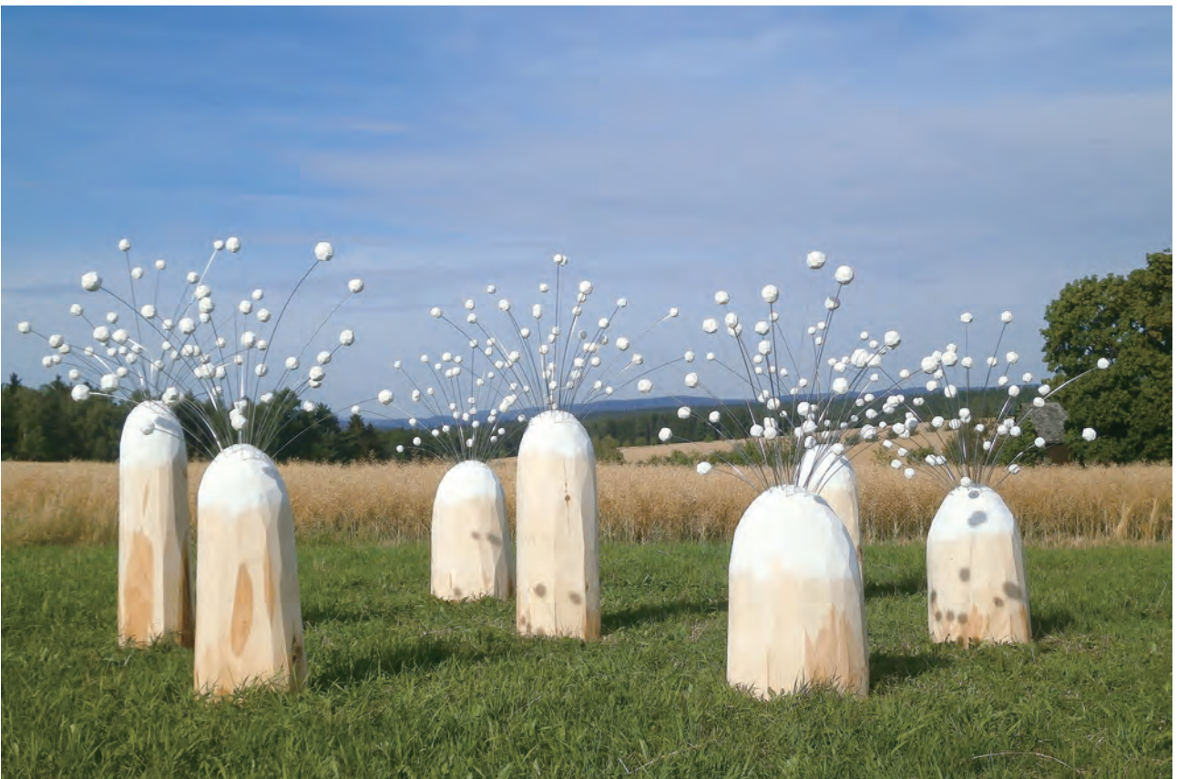
【7つの風に吹かれて】 1000×800×300cm 菩提樹、楠、ステンレス棒