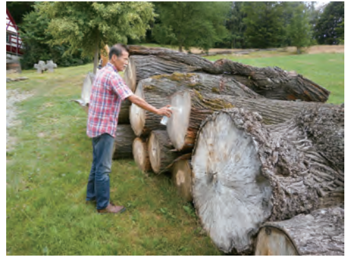
選んだ素材に印を付ける