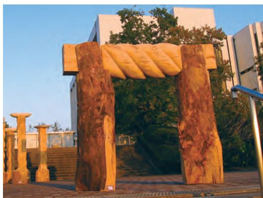
2011年 D2ギャラリー前 「風門」 220×70×210cm 楠