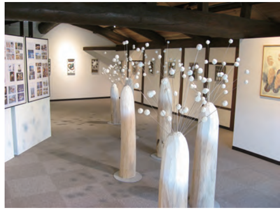
富山県福光 ギャラリー「耀」 個展 2015年5月