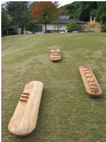
小牧野外彫刻展2013 「プロメテウスの舟」 II 600×200×30cm 楠