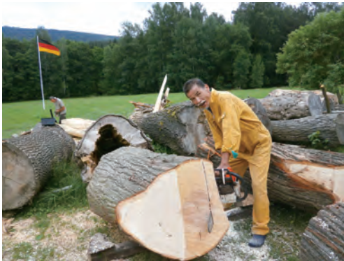
エンジンチェーンソーであら取りをする