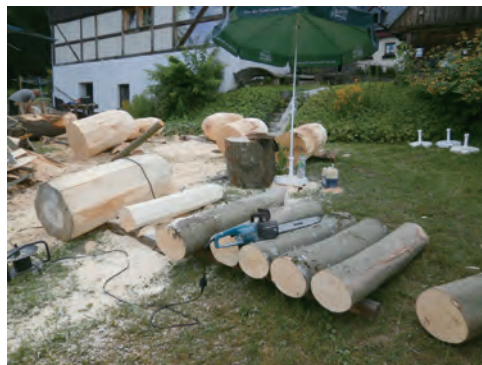
手前にある7本のブナの木はこの裏山で切り倒したものである