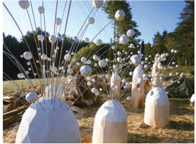
制作会場での仮設置