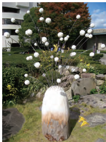
小牧野外彫刻展2013メナード美術館庭園「風に…」 120×120×200cm 楠、ステンレス棒