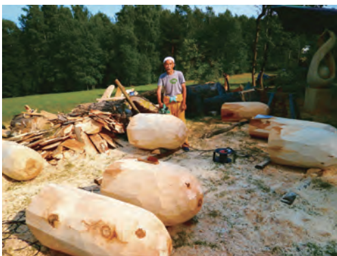
7つの作品のベースとなる部分